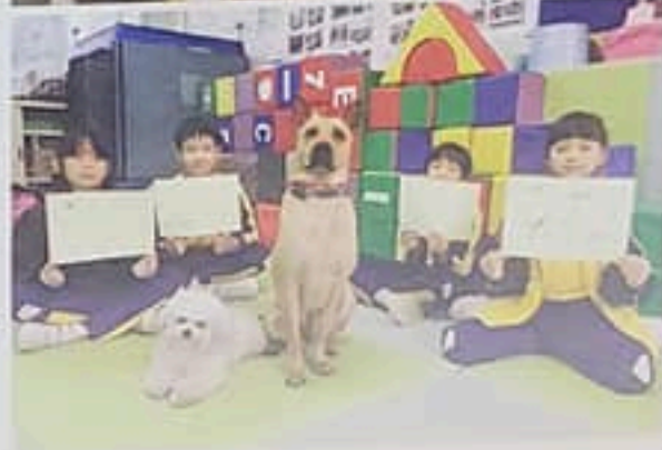
工作犬與小小領犬員一同學習，建立良好的人犬關係。