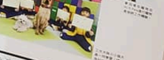
「牠」是北極探險隊的成員，負責照顧隊員，並協助隊員完成工作。

「牠」是北極探險隊的成員，負責照顧隊員，並協助隊員完成工作。牠在探險隊中，負責照顧隊員，並協助隊員完成工作。牠在探險隊中，負責照顧隊員，並協助隊員完成工作。牠在探險隊中，負責照顧隊員，並協助隊員完成工作。