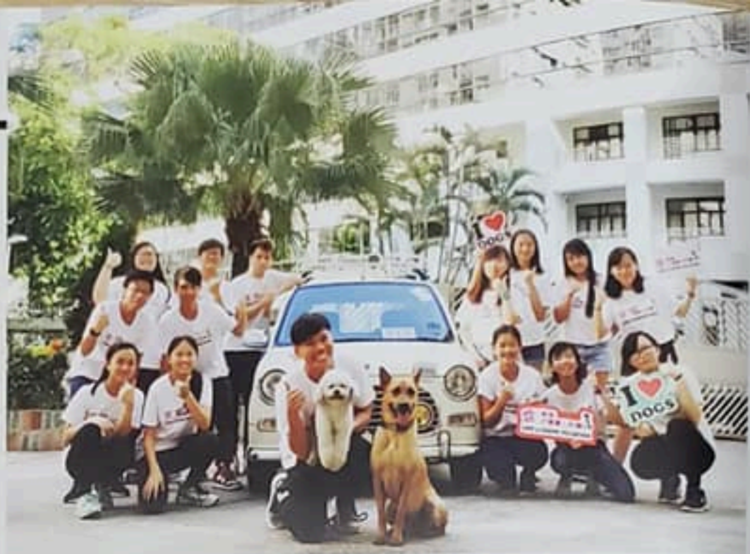
《愛·無限犬隻義工計劃》領犬義工團隊以多元化的服務，服務社區上有需要的社群。

近年「寵物融入社區」的議題成為城中熱話，今期《時事追擊》為大家報導由循道衛理楊震社會服務處籌辦的《愛·無限犬隻義工計劃》，計劃提倡「人狗共融、人狗互助」，透過專業社工、犬隻訓練師、領犬義工及受助犬隻等介入，以「動物治療」及「動物輔助活動」手法應用到兒童及青少年服務當中，帶狗兒走進學校，甚至社區，宣揚人狗共融、互助的概念。