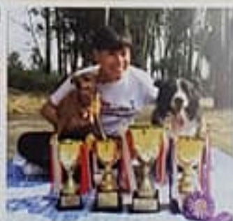
用「最」最令人感動的是看到很多參加計劃的學生建立了對自己的信心和責任心。