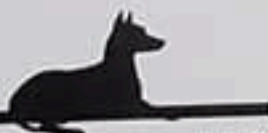
McQueen與優福的 感情非常好。