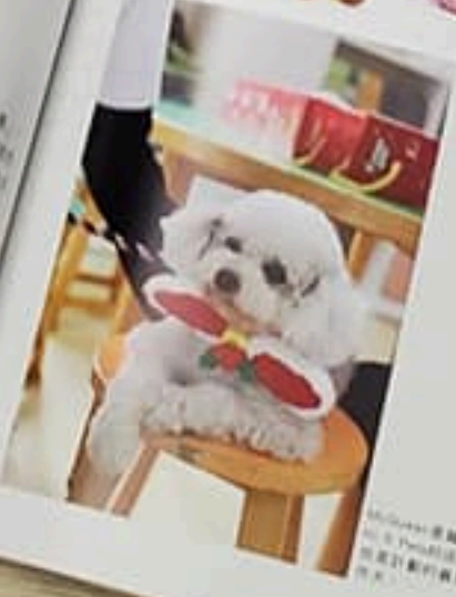
「牠」是北極探險隊的成員，負責照顧隊員，並協助隊員完成工作。

「牠」是北極探險隊的成員，負責照顧隊員，並協助隊員完成工作。牠在探險隊中，負責照顧隊員，並協助隊員完成工作。牠在探險隊中，負責照顧隊員，並協助隊員完成工作。牠在探險隊中，負責照顧隊員，並協助隊員完成工作。