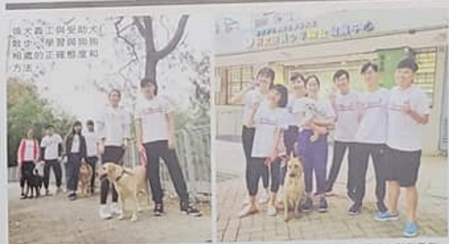
自2012年至今，每年暑假，計劃均開辦一屆領犬義工證書課程，這是第八屆領犬義工證書課程畢業生。