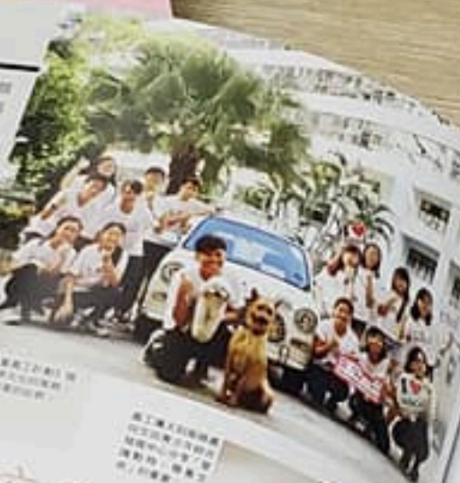
「愛·無別式專業計劃」由 犬類服務處與僑團合作， 協助視障人士、聽覺障 人士、行動不便人士等。

這本「關於融入社區」的議題 成為中流砥柱。今期《時事 觀察》為犬類服務由僑團牽頭 與社會服務處合作的《愛·無 別式專業計劃》，計劃透過 「人狗共融、人和互助」，透 過專業社工、犬隻訓練師、視 障人士及失聰人士等介入，以 「動物治療」及「動物輔助活 動」手法應用於兒童及青少年 服務當中，帶牠們走進學校、 甚至社區，宣傳人狗共融、互 助的概念。