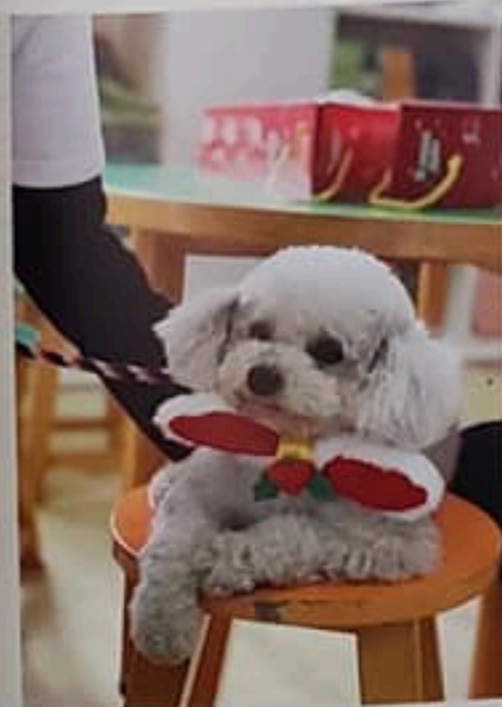
McQueen是寵物店Hi-5 Pets的店長，也是計劃的義務工作犬。