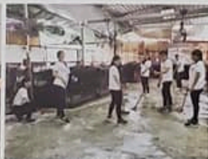
義工到動物收容所清潔犬舍。