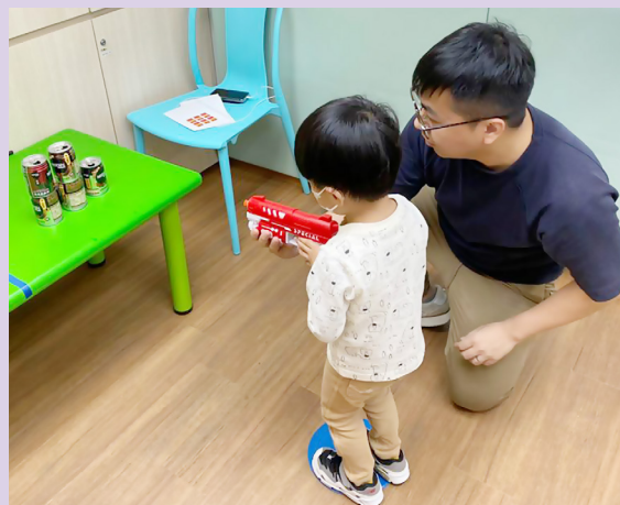
活動中考驗學童手眼協調及聆聽指令的能力。

除了恆常的到校及中心訓練，我們特意在復活節期間舉辦「早苗樂園」活動，讓學童的訓練不只受限於學校進行，更可於日常生活中訓練各方面的能力。「早苗樂園」設置多個遊戲，融入訓練元素於其中，