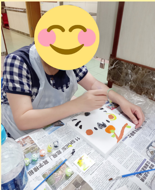
服務幹事為舍友提供藝術小組，培養舍友之生活興趣，陶冶性情。