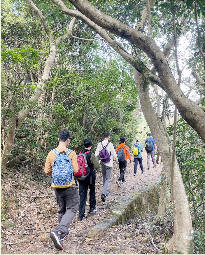
定期進行行山活動。

中心會員於日常生活中，較少機會可以與同儕參與不同的活動，缺少社交經歷與同儕維持對話以建立關係。因此中心於策劃不同的活動和小組中，秉持「謙遜務實」的精神，旨為會員提供自然的社交平台和機會，期望他們能與其他會員互動，更可將相關的經歷應用於日常生活中，有助建立自己的社交網絡。