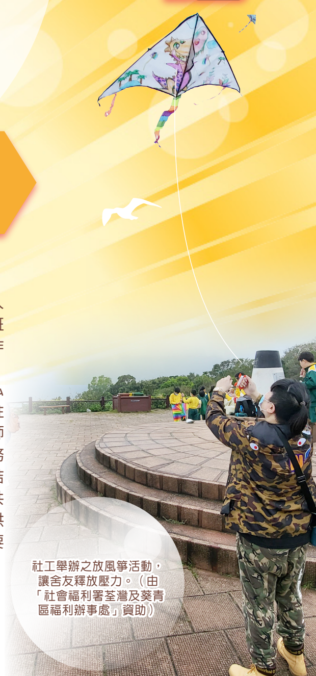
社工舉辦之放風箏活動，讓舍友釋放壓力。（由「社會福利署荃灣及葵青區福利辦事處」資助）