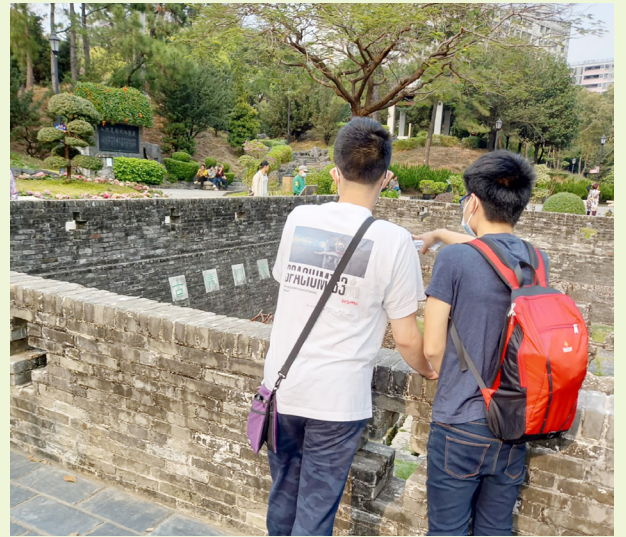
由會員自行選擇活動路線，並規劃活動，猶如日常中與朋友決定外出活動的情況。

中心致力為15歲或以上的高功能自閉症人士及其照顧者提供支援，包括職業技能提升及就業、人際關係、獨立生活、社區共融及個人健康。促進「人際關係」的部分亦會是中心重點發展的方向之一。