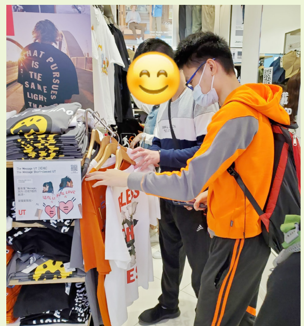
由會員自行選擇活動路線，並規劃活動，猶如日常中與朋友決定外出活動的情況。