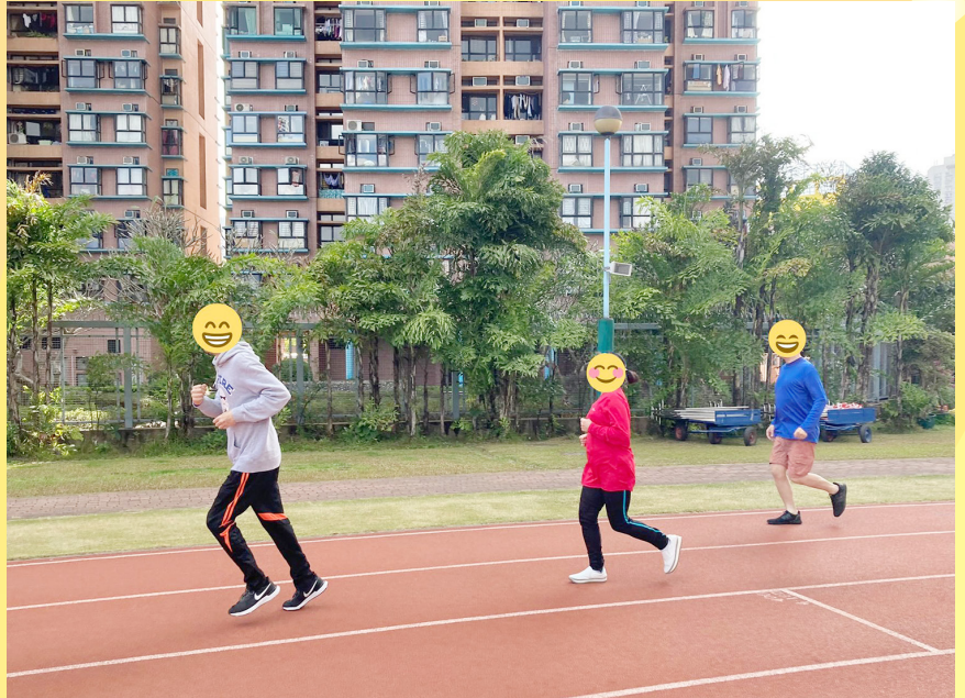
治療師與復康工作員舉辦的「健步行、走、跑」活動，舍友積極參與，跑起來不輸職員呢！