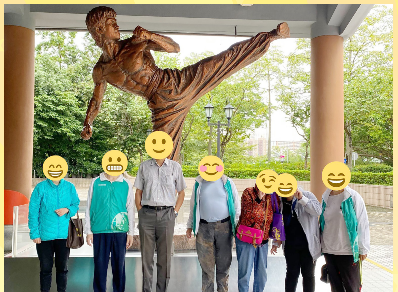
復常啦！終於可以走出院舍，參觀花展及博物館。