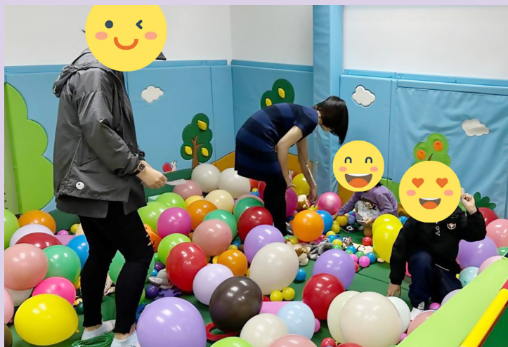
學童與家長合力在波波池中尋找復活節拼圖。

包括小肌肉、手眼協調、言語表達、社交溝通等，讓學童在假期及日常生活中都能學習及鞏固各能力。是次活動更邀請家長一同參與，藉此增強親子間的合作性，提升親子關係。