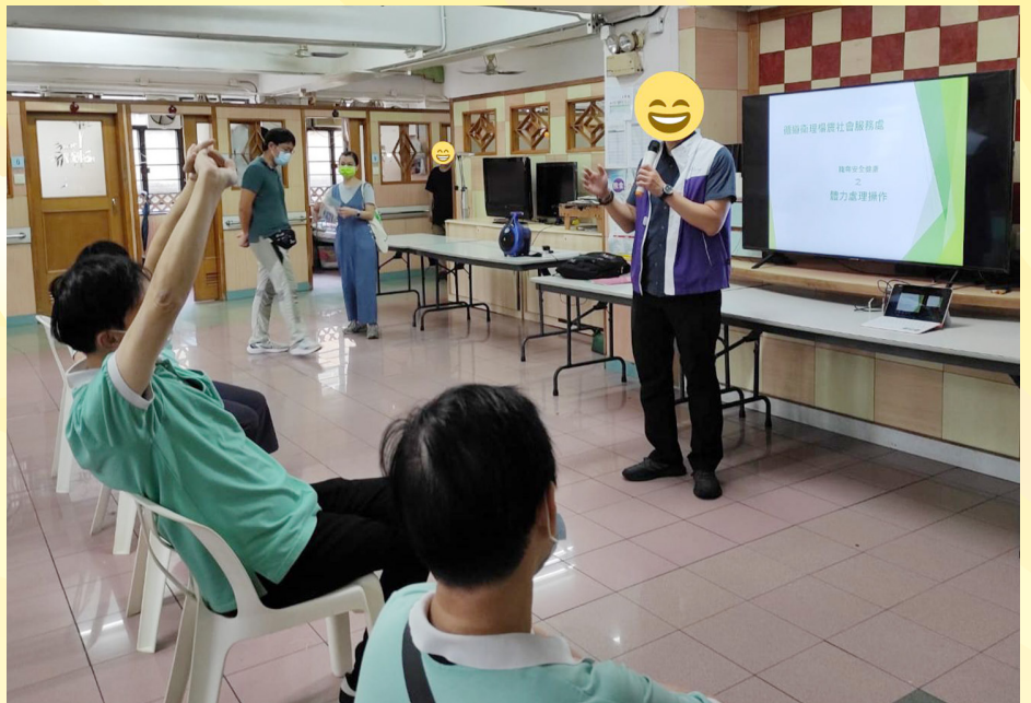
治療團隊定期為院舍員工提供在職培訓。