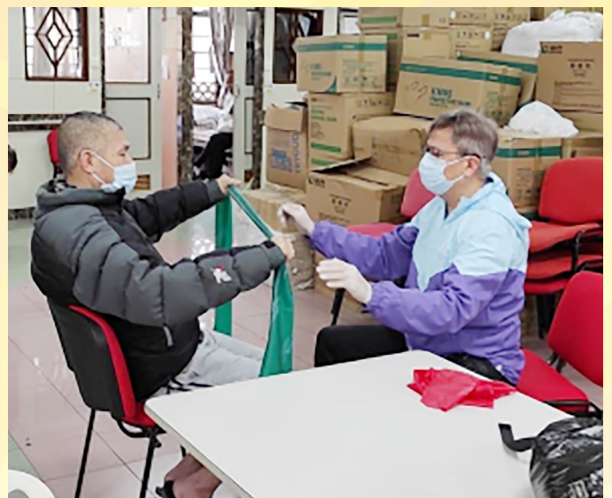
復康工作員協助舍友進行由治療師建議之治療訓練。