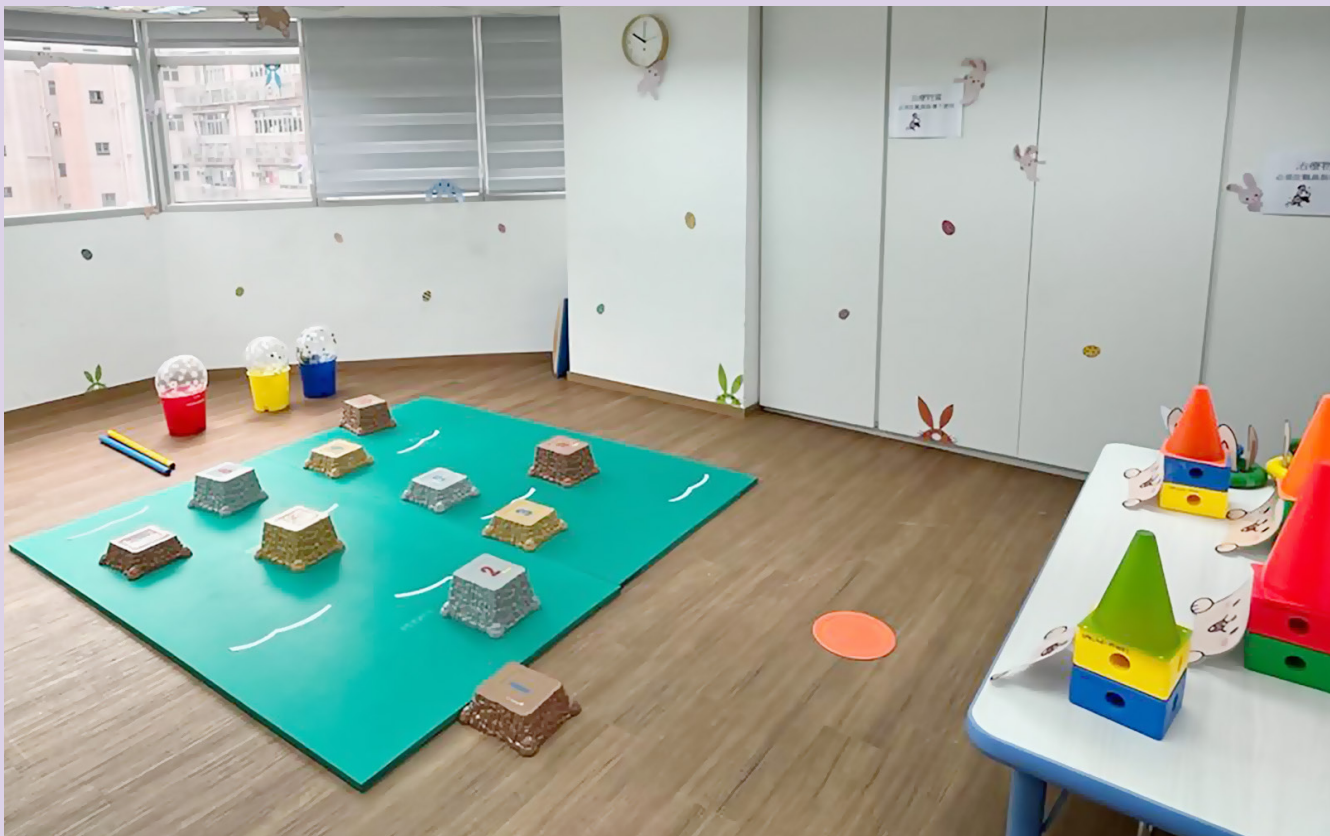
我們在中心設計了過3關遊戲，學童先將圈拋在雪糕筒上，再跳過障礙物過河，最後和家長合力運送復活蛋。

包括小肌肉、手眼協調、言語表達、社交溝通等，讓學童在假期及日常生活中都能學習及鞏固各能力。是次活動更邀請家長一同參與，藉此增強親子間的合作性，提升親子關係。