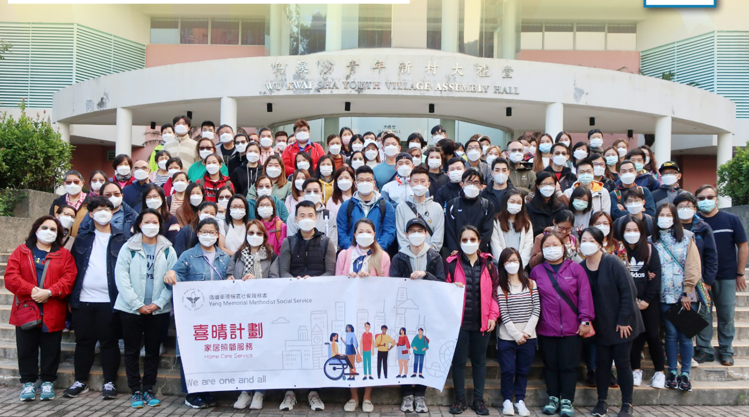
三區各職級職員大合照