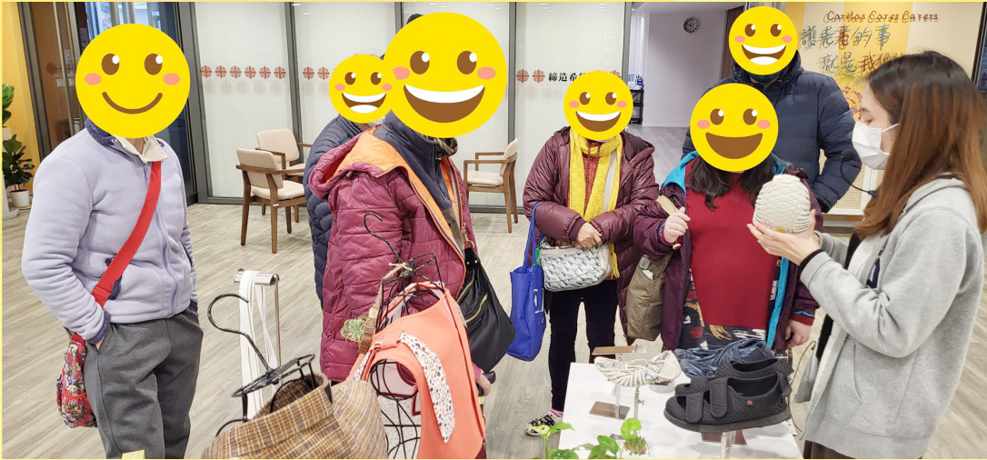
社工舉辦之家屬活動——「參觀照顧者資源及支援中心」，讓家屬們加深對樂齡科技產品之認識。 （由「社會福利署荃灣及葵青區福利辦事處」資助）