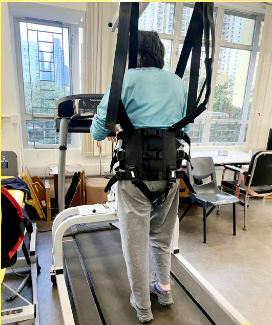
治療師帶舍友到本處轄下另一復康單位——「深水埗區晉晴支援中心」使用復康器材進行訓練。