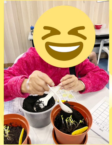
社工為舍友舉辦園藝治療小組活動，藉此改善院友的心理康復。