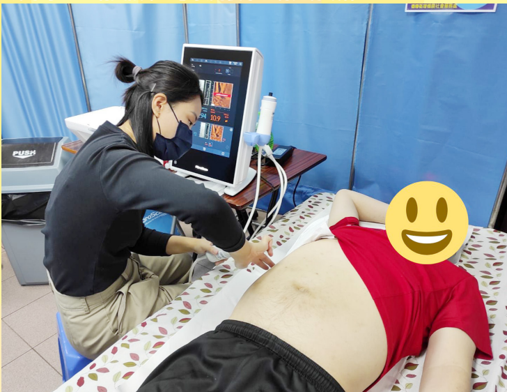
由精神科護士籌備，與創立（香港）有限公司合作，為院友提供肝臟纖維掃描檢查。

隨著疫情緩和，社會復常，加上本隊已於2023年3月25日起轉為恆常化服務，本隊職員在未來日子將以「專業而謙遜；務實而創新」的工作態度，細心聆聽服務使用者之需要，繼續為他們提供多元化的服務。例如：本隊將會與不同的社區組織合作，冀望社群之間在社區重新連結，拉近社交距離，達致社區共融；另一方面，配合樂齡及康復創科應用基金的資助，我們亦將引入更多的復康訓練儀器，以協助舍友延緩身體老化，促進身心健康。