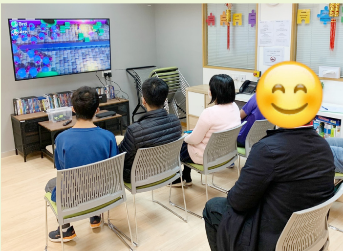
每個星期五會員都可以到中心選擇自己喜歡的遊戲／電影，與其他會員一同參與。