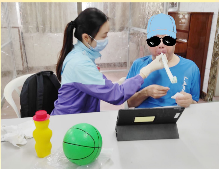
言語治療師為舍友進行訓練。

「如今常存的有信，有望，有愛；這三樣，其中最大的是愛。」（哥林多前書 13:13）本隊職員將繼續以愛祝福生命，以生命改變生命，讓服務使用者在身、心、社、靈都得到滿足，提升整體生活質素。