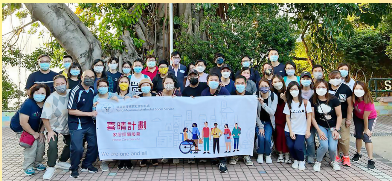
九龍城區退修日——各職級職員合照