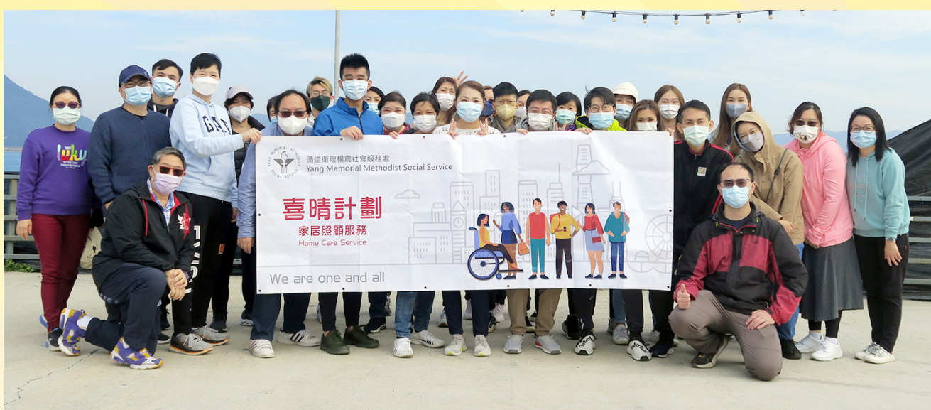
將軍澳區退修日——各職級職員合照