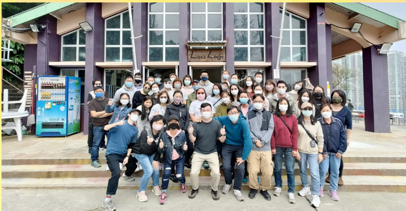
深水埗及油尖旺區退修日——各職級職員合照