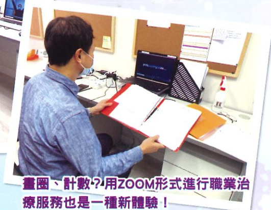
畫圈、計數?用ZOOM形式進行職業治療服務也是一種新體驗!