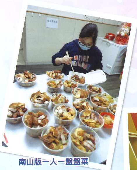
南山版一人一盤盤菜

新年宿舍活動真係多，舞獅、泡泡好好玩，盤菜人人有份食，舍友抱肚叫飽飽；初二開年有舞獅，仲有親朋好友視訊來拜年。恭喜發財！利是逗來！舍友日日有利是，祝福新一年人人大吉大利！