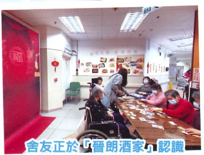
舍友正於「晉朗酒家」認識不同點心的款式。