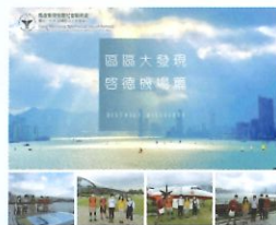
區區大發現 - 啟德郵輪碼頭參觀