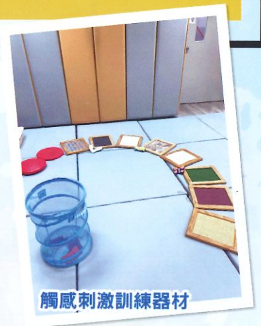
觸感刺激訓練器材