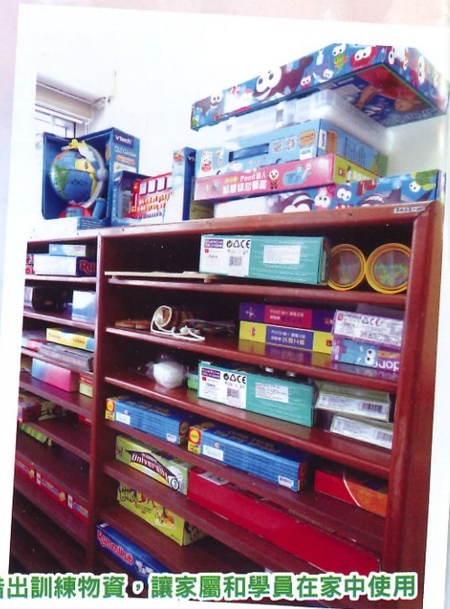
中心借出訓練物資，讓家屬和學員在家中使用

中心看見此情況，希望學員在家亦能夠接受一些訓練，故此向家屬了解意願後，安排進行視像訓練，與及借出一些教材，讓家屬陪同學員在家中使用。希望能讓學員在家亦能「停課不停學」。