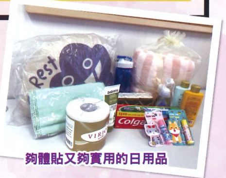
夠體貼又夠實用的日用品