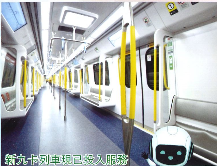
新九卡列車現已投入服務

除了QR Code入閘機，港鐵同時新增了東鐵綫九卡列車，以配合港島區新鐵路路段的空間限制下營運需要。九卡列車投入服務後，東鐵綫的十二卡列車將會陸續被更換。新九卡列車的車廂比現有列車車廂稍闊，車廂內的設備亦經過改良，以提供更寬敞舒適的乘車環境。新列車設有動態路線圖及車卡連接通道顯示屏，方便乘客於旅途中掌握更多資訊。