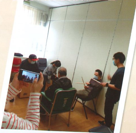
攝錄小組過程供會員網上重溫