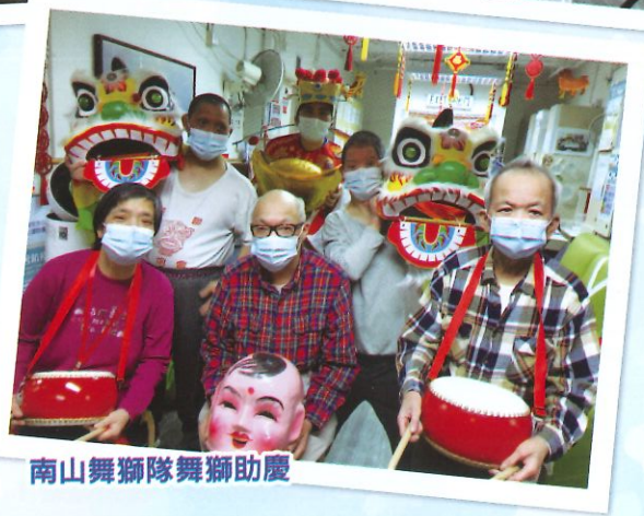
南山舞獅隊舞獅助慶