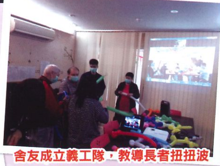
舍友成立義工隊，教導長者扭扭波