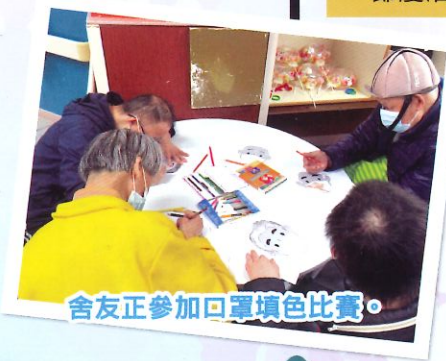
舍友正參加口罩填色比賽。