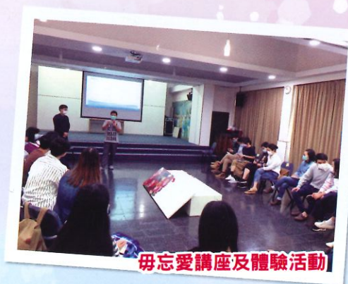
毋忘愛講座及體驗活動