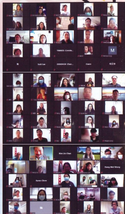
網上「預設醫療指示及在家離世」培訓工作坊