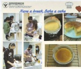
日式輕芝士蛋糕製作