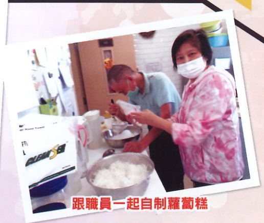
跟職員一起自製蘿蔔糕