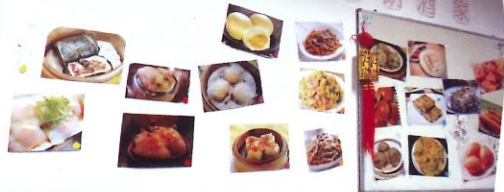
「晉朗酒家」提供了各式各樣的點心予舍友選擇。