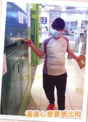
滿滿心意要寄出啦