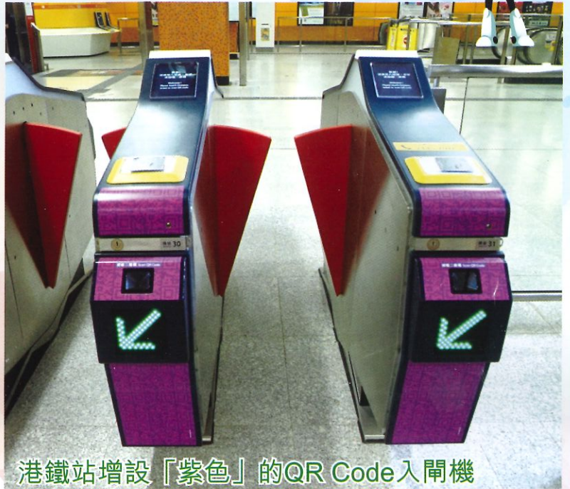
港鐵站增設「紫色」的QR Code入閘機

手機利用QR Code直接入閘搭港鐵已於1月23日正式啟動！現在可使用MTR Mobile綁定AlipayHK及揀選港鐵的「我的車票」，或使用AlipayHK的易乘碼（EasyGo）使用二維碼乘車服務。港鐵全部93個車站（機場快綫車站除外），於每一排閘機均會設置最少兩部閘機可提供二維碼付費乘車服務，並且會包上紫色顯眼標示。以後過閘有了新選擇，一掃便能起行！