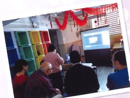
用ZOOM 跟友好單位拜年，祝大家身體健康