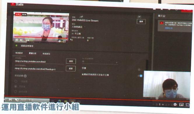
運用直播軟件進行小組

疫情期間不少會員都留在家中避疫而減少到中心，為了讓他們在這段期間繼續能參與各類型小組，保持與中心的聯繫，中心近月開始以網上直播形式進行小組，讓會員在家中避疫時亦能繼續參與小組。而未能即時參與直播的會員亦能在稍後時間觀看視像重溫。此外，為加強與會員及家屬的聯繫，中心亦建立了Whatsapp通訊渠道，使中心聯絡和發放資訊的工作更加便利和快捷。