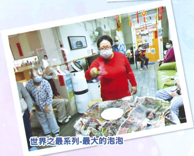
世界之最系列-最大的泡泡