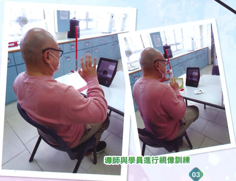
導師與學員進行視像訓練