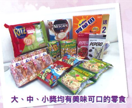
大、中、小獎均有美味可口的零食