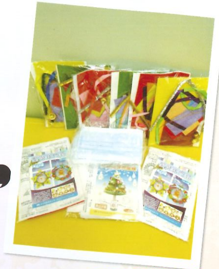
中心向學童及家長派發聖誕禮物包