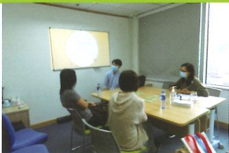
星星孩子家長工作坊