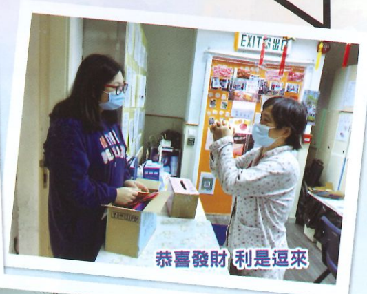
恭喜發財 利是逗來