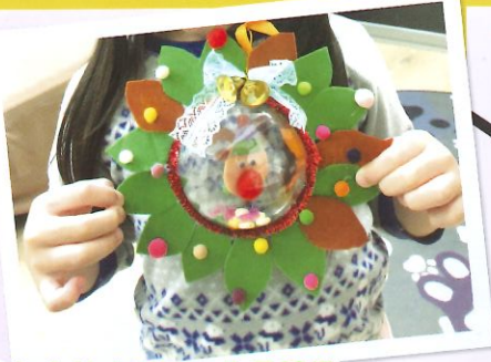
家長和學童一同製作禮物包內的小手工，作品精緻。