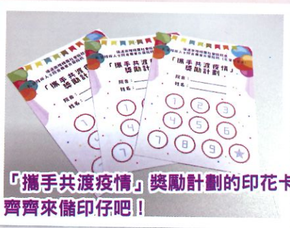
「攜手共渡疫情」獎勵計劃的印花卡，齊齊來儲印仔吧！