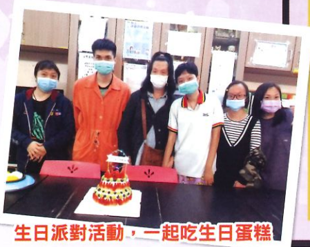
生日派對活動，一起吃生日蛋糕

單位成立了義工隊，跟區內的長者進行共融活動，在新春佳節，透過用ZOOM形式，教授長者學習扭扭波，大家一起扭出不同形狀的動物或物品，突然『拍』的一聲，一個氣球爆破了……大家充滿歡笑聲！