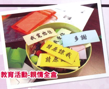
教育活動-親情全盒