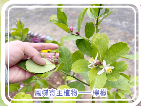
鳳蝶寄主植物——檸檬

現時蝴蝶友善園圃由屯門朗逸居舍友及私營殘疾人士院舍專業外展服務舍友恆常進行植物護理工作，看著各舍友由對植物及蝴蝶零認識，及至現在懂得保護蝴蝶幼蟲繁殖及按季更換蜜源植物，更敢於義務到不同學校舉行蝴蝶生長介紹活動，推行生命教育及環保教育，為香港生物多樣性保育工作出一分力。舍友們的保育相關知識、自信心均大大提升，期望舍友們會再繼續努力，持續進步。