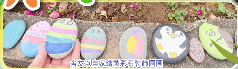
舍友以自家繪製彩石裝飾園圃

本機構於屯門市中心附近的屯門朗逸居宿舍環境清幽，更於宿舍室外環境設有不同園圃，為市區內不同的昆蟲或雀鳥提供棲息地。2024年初，宿舍將其中一個農作物園圃變成「蝴蝶友善園圃」，特別為市區常見的蝴蝶種植不同寄主植物及蜜源植物，為其提供棲息地及繁殖地，更發現有從香港以北越冬的青斑蝶到園圃棲息。蝴蝶友善園圃為蝴蝶及蜜蜂兩種主要傳播花粉昆蟲提供穩定蜜源，傳播花粉昆蟲同時促進區內開花植物／農作物生長，令依賴植物生長的不同種類昆蟲及於食物鏈上層的雀鳥有足夠食物供應。