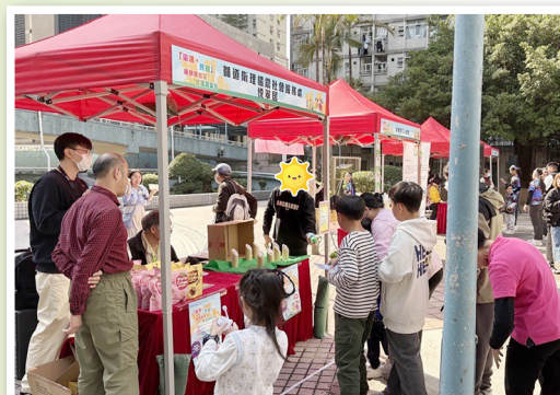
成為活動攤位負責人

舍友們從過往只是活動的參與者，個性較害羞、缺乏自信，至現在已蛻變成活動的策劃及提供者，無論於場地佈置、遊戲策劃與安排都盡顯心思，並敢於帶領及透過樂齡與運動相關的攤位活動，為樂富區居民帶來歡樂及宣揚社區和諧及傷健共融的重要！