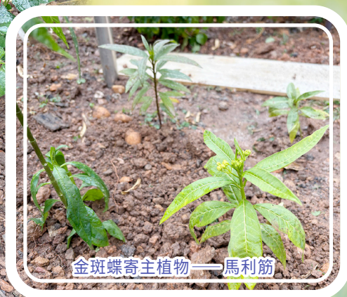
金斑蝶寄主植物——馬利筋