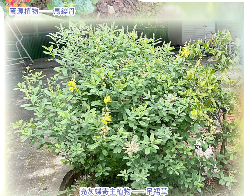
亮灰蝶寄主植物——吊裙草