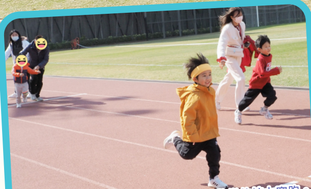
學童展現最佳表現，享受充滿活力和歡樂的接力賽跑。

西九龍一區共13對親子參加聯區親子運動會，大朋友和小朋友都熱烈參與，更贏取啦啦隊比賽第一名。