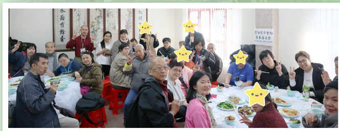
舍友與家人聚首一堂享用素菜