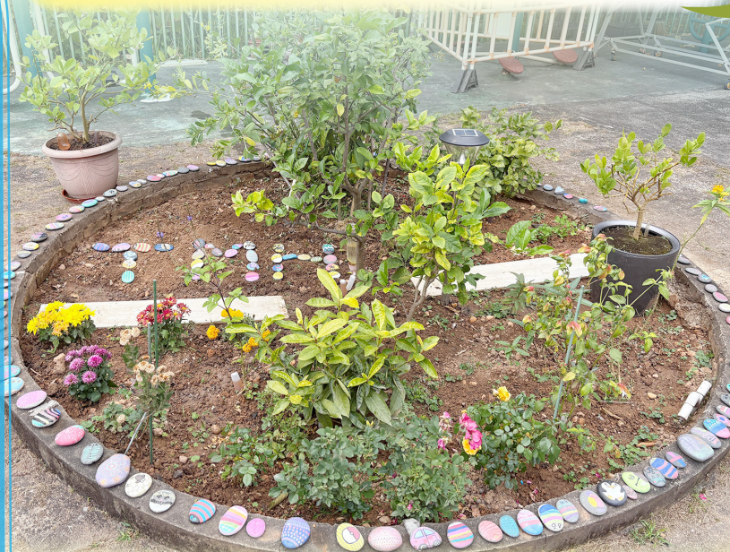
蝴蝶友善園圃種植不同寄主植物及蜜源植物