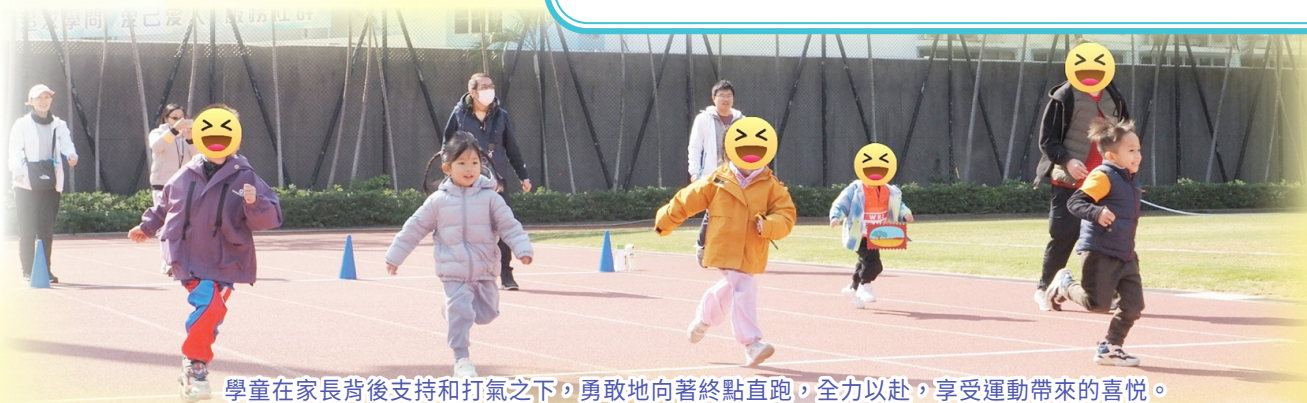
學童在家長背後支持和打氣之下，勇敢地向著終點直跑，全力以赴，享受運動帶來的喜悅。

運動會由職業治療師及專業團隊聯合設計，帶領五區一系列充氣活動及有趣的親子體能遊戲。活動項目包括學童5X20米短跑、接力賽、親子賽跑、親子障礙賽及成人接力賽等等。透過不同的體能活動幫助孩子訓練大小肌肉以增強四肢穩定性，學習與體驗運動精神，建立自信；家長投入過程和孩子舒展身軀，享受優質親子時光，共同創造美好回憶。