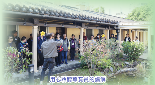
用心聆聽導賞員的講解