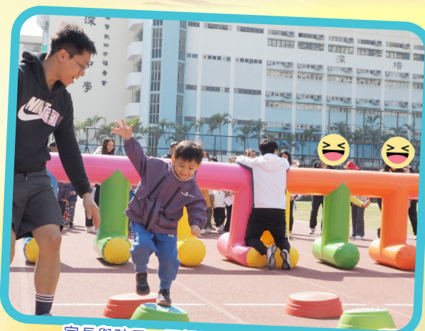
家長與孩子一同經歷過程中所獲得的快樂。