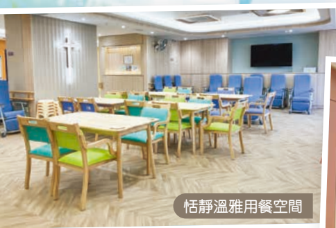
恬靜溫雅用餐空間