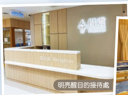
明亮醒目的接待處