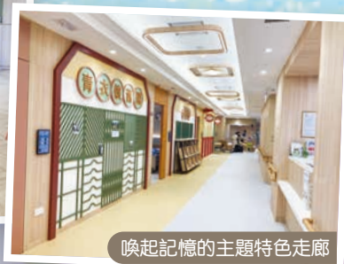
喚起記憶的主題特色走廊